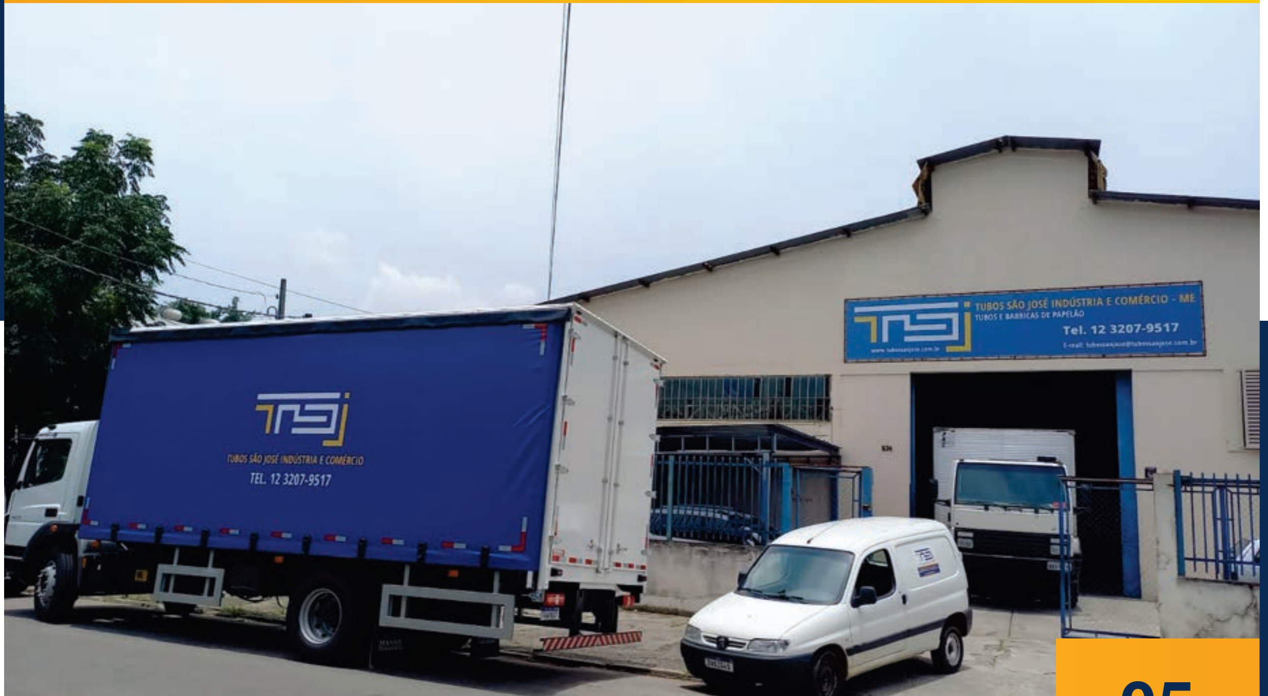
Fachada principal da empresa